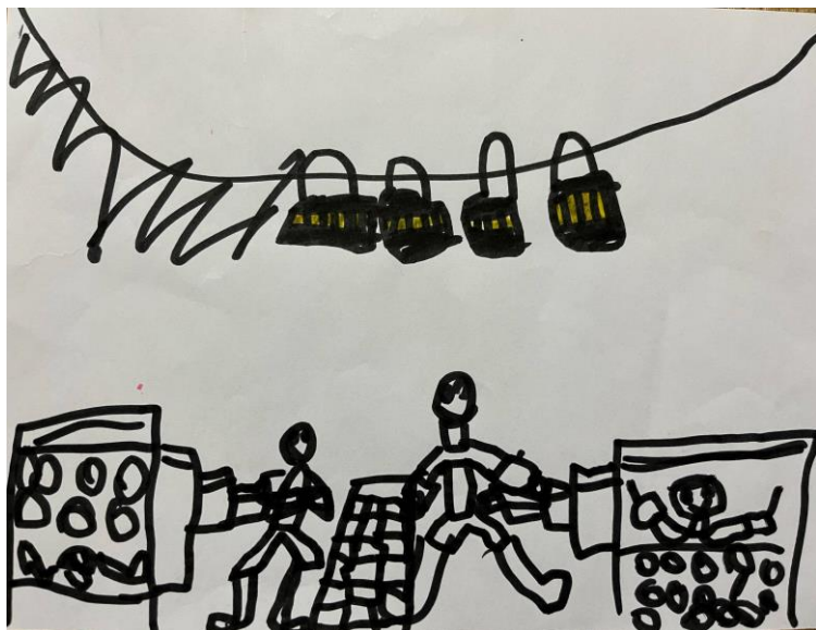
「夏まつりやねん。たこ焼きやさんとお面やさん 上にはちょうちんとサーカスの旗あるねん」5歳児