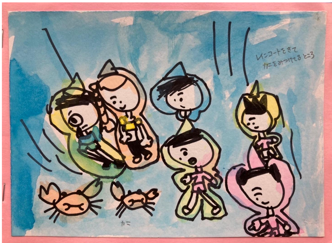
「雨の中レインコート着てカニをみつけたよ」 5歳児

日 時 2022年11月19日(土) 午前9時～午後4時30分 研修会会場 龍谷大学 深草キャンパス 和顔館 B101 教室 他 京都市伏見区深草塚本町67 主 催 京都幼年美術の会 後 援 公益財団法人 美育文化協会 協 賛 ぺんてる株式会社