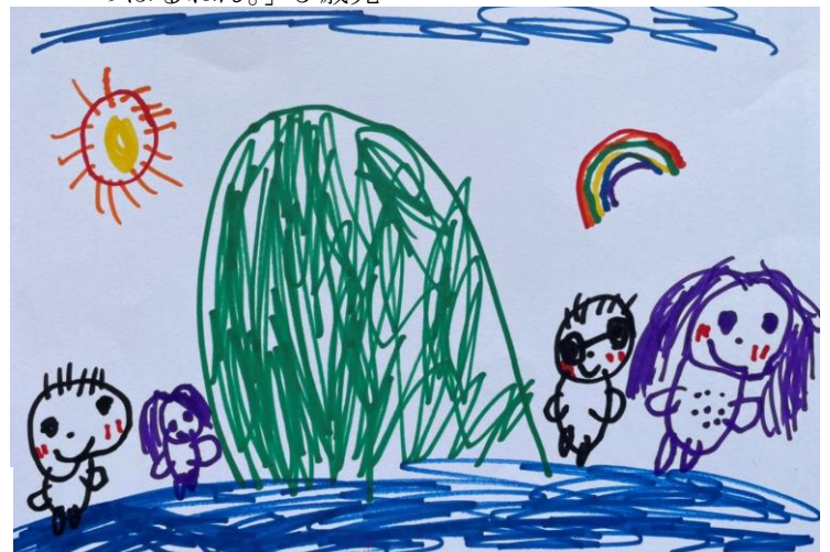
「家族で沖縄に行ったらタッチュー (伊江島の山) のぼるねん。」5歳児