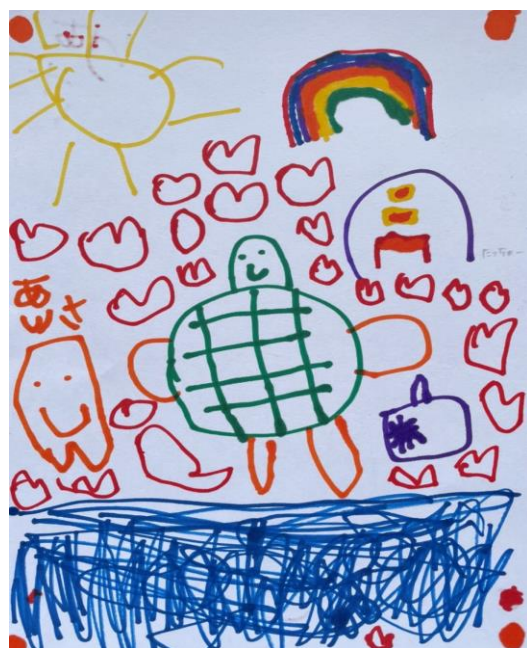
「ウミガメとジュゴンとハート」5歳児