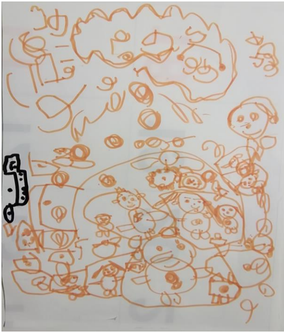
妖怪ウォッチの妖怪たち 3歳児