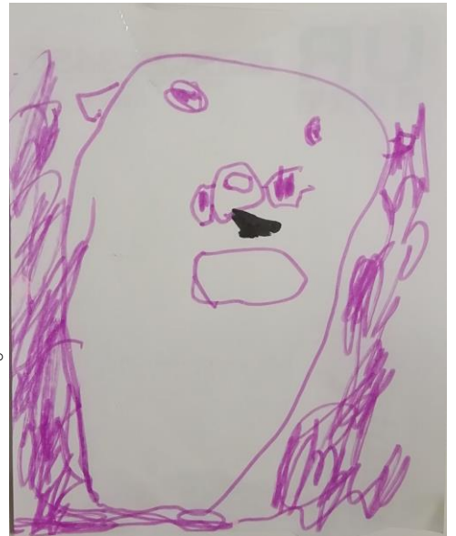
アンパンマン 3歳児