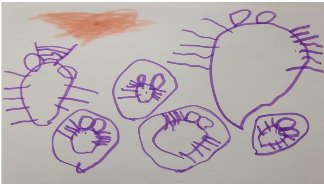
クワガタの幼虫とクワガタ大きいゴキブリがたまごをおそおうとしている 4歳児