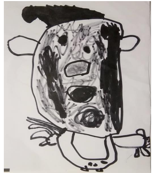
ブラックさんた 3歳児